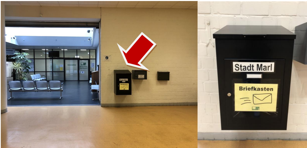
Wartebereich vor dem Bürgerbüro im Riegelhaus

Wenn Sie in diesen Briefkasten einwerfen, müssen Sie kein Porto (Briefmarken) auf den Umschlag kleben.