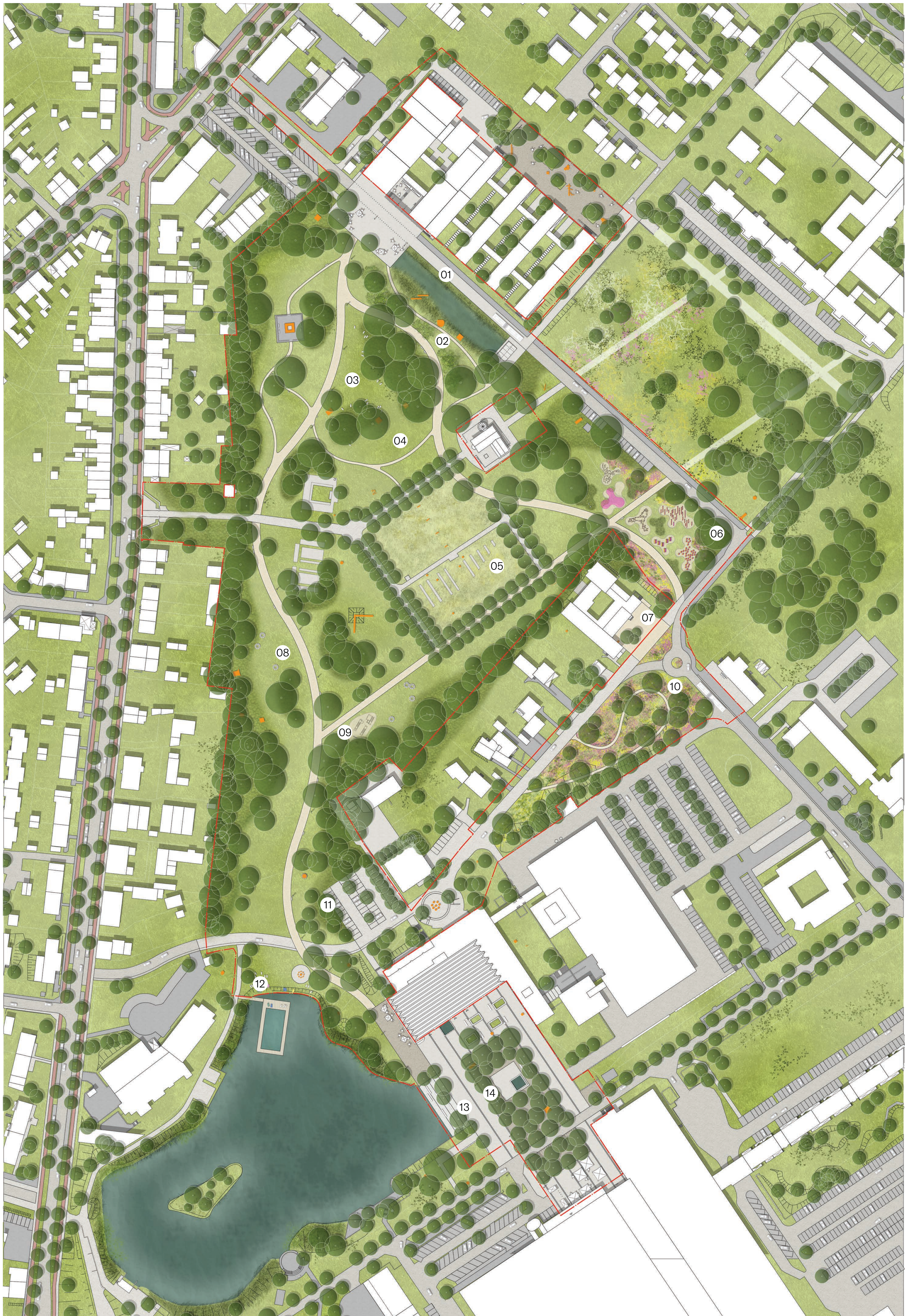
Lageplan M 1:1000