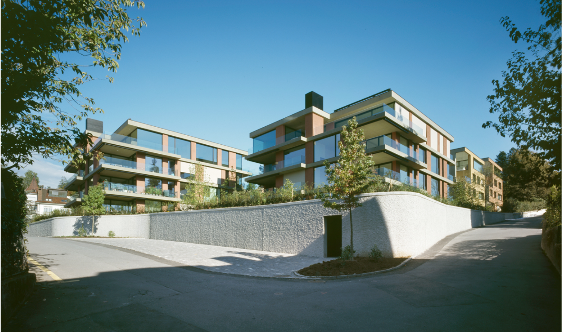
Referenzen: Stadthäuser und Stadtvillen in Luzern