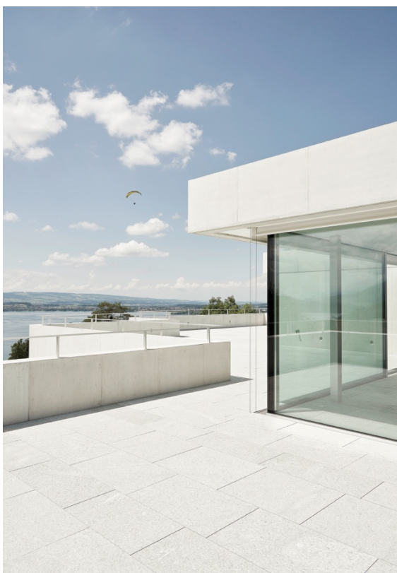
Referenzen: Einfamilienhaus in Zug