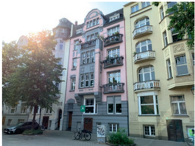
Altbauten in Düsseldorf

Die durchschnittliche Wohnfläche in den Großstädten des Ruhrgebiets ist verhältnismäßig gering. Das ist ein Ergebnis des Zensus 2022. Insbesondere in Gelsenkirchen (76,6 Quadratmeter) und Duisburg (77,6 Quadratmeter) waren die Wohnungen unterdurchschnittlich groß (Nordrhein-Westfalen: 92,7 Quadratmeter). Auch in der Rheinschiene mit Düsseldorf und Köln sind Wohnungen im Schnitt kleiner als in Gesamt-NRW. (IT.NRW)