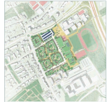
Grafik: Stadt Bochum