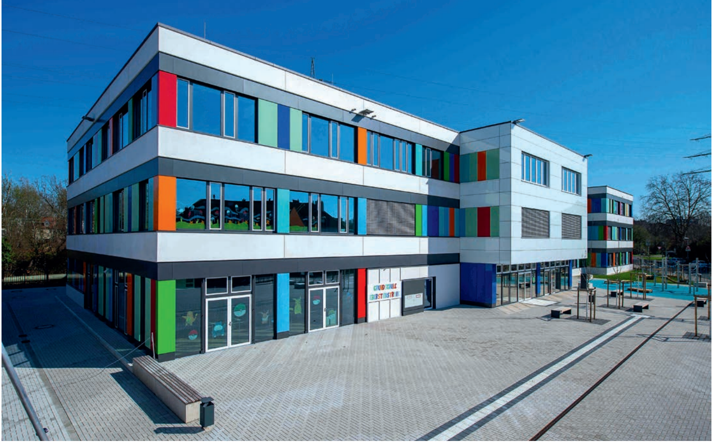
Grundschule an der Elbersteinstraße Gelsenkirchen