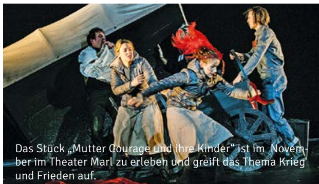
Das Stück „Mutter Courage und ihre Kinder“ ist im November im Theater Marl zu erleben und greift das Thema Krieg und Frieden auf.

Rein literarisch betrachtet hat diese Erzählung eine faszinierende Stilistik, die es zu einem Meisterwerk macht. Außerdem beschreibt wohl kein Roman im literarischen Kanon die Schrecken des Ersten Weltkrieges wie dieser.