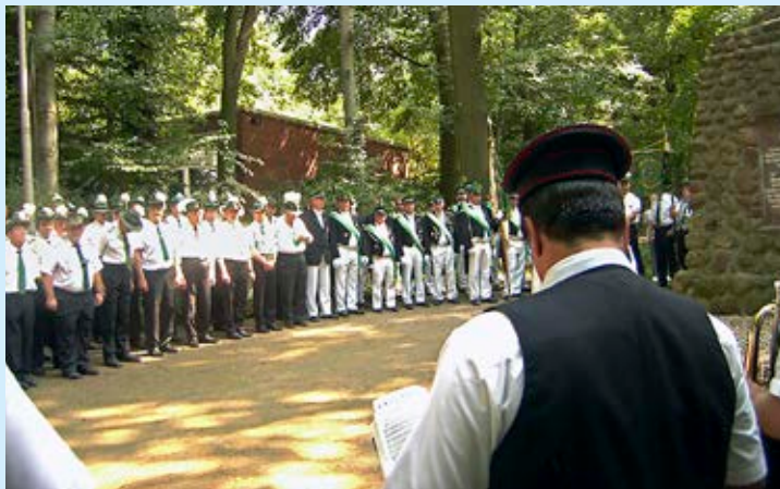
Schützenfest des BSG Marl Sinsen vom 8.–9. August