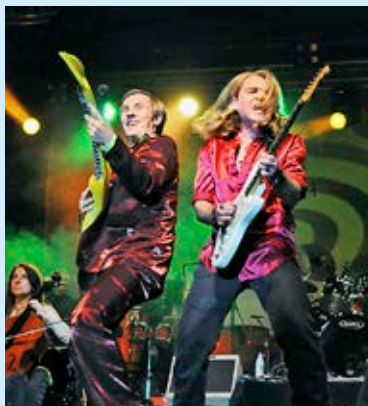
Haldenglügen am 22. August