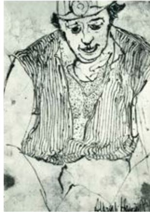
Bergmann im Revier III von Alfred Schmidt