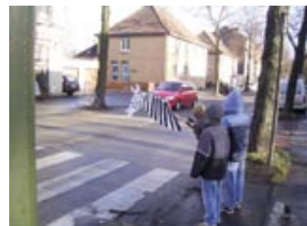
Geht doch! Jetzt werden wir gesehen und die Autos halten an!