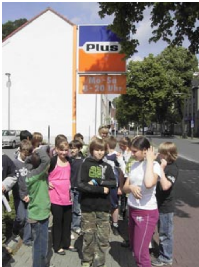
Hier stehen wir vor dem neugebauten PLUS-Markt am Lipper Weg (heißt heute „Netto-Markt“)

Zur Übersicht noch einmal alle Symbole des Kinderstadtplans Hüls-Nord: