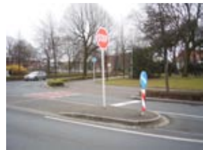
Gut, dass in der Nähe ein Gebüsch wächst...