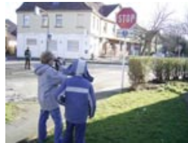
Dritter Drehort Sickingstraße: Eine Hecke nimmt weitgehend die Sicht auf querende Kinder!