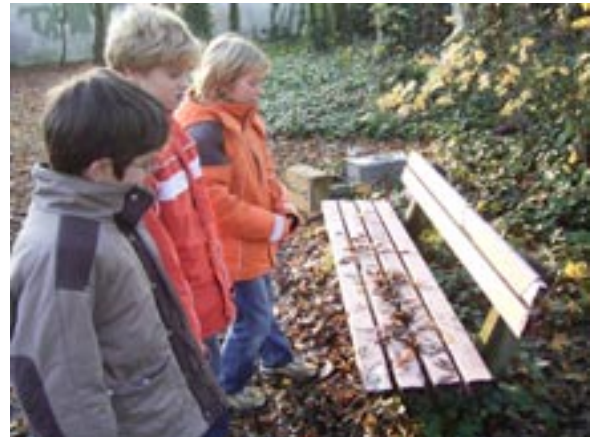
Aber schon ein wenig weiter auf dem Spielplatz an der Dormagener Straße sieht es nicht so toll aus: Trostloser Sandkasten, kaputte Sitzbänke, umgestürzte Mülleimer