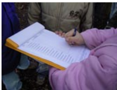
Alles wird genau aufgeschrieben und in unsere Tabelle eingefügt