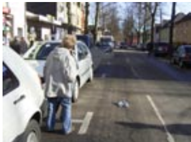
Neuer Versuch: Erst schaut das Nashorn vorsichtig ob frei ist...