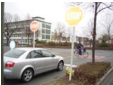
Hier an der Einmündung der Paul-Baumann-Straße in den Lipper Weg fahren viele Autofahrer einfach durch ohne anzuhalten. Dabei bringen sie Fußgänger und Radfahrer in Gefahr.