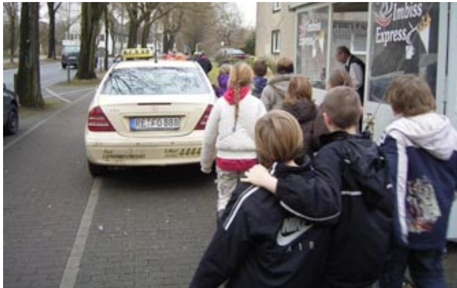
Das fanden wir gar nicht gut: Ein Taxi parkte am Lipper Weg vor dem „Imbiss-Express“ auf dem Gehweg. Da wurde es ganz schön eng!

Aber die dreistesten Falschparker in unserer Stadt sind immer noch die Taxi-Fahrer!