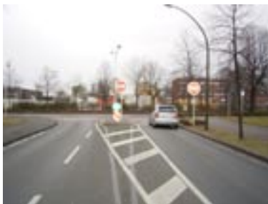
In einer dritte Aktion haben wir uns als Stop-Schild-Detektive versucht!