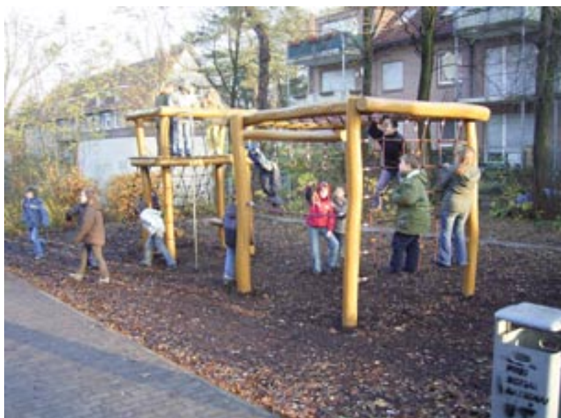
Der Spielplatz auf unserem Schulgelände

Diese Symbole im grünen Kasten beschreiben Orte, die wir als Kinder gerne aufsuchen und die Erwachsenen vielleicht gar nicht kennen. Einerseits sind dies offizielle Spielplätze , aber auch Wegekreuze , Denkmäler , Fußball- oder Bolzplätze , Kletterbäume oder auch unsere Drachenwiesen , auf denen wir im Herbst den Windvogel steigen lassen.