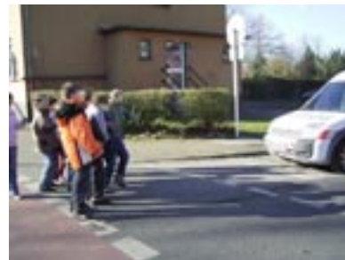
Wieder tauchen Kinder unerwartet auf der Fahrbahn auf!