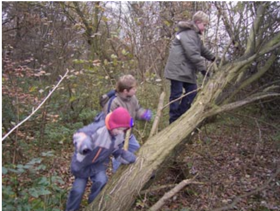
Im ‚Dschungel‘ am Gleis-Dreieck

Da wir uns gern in der Natur aufhalten, finden wir im Kinderstadtplan auch Angaben zu Grün- und Freiflächen (das sind die großen farbigen Flecken auf dem Plan). Weil diese unterschiedliche Qualitäten und Möglichkeiten anbieten, unterscheiden wir nach Spielwiese (grün/gelb) zum Fußballspielen oder Fangen, Grünanlage (saftiges Froschgrün) für Freizeitaktivitäten, Wald (dunkelgrün) zum Verstecken und Buden bauen, Wiese/Weide (hellgrün) und Feld/Acker (gelb) zum Rumtoben oder Drachen steigen lassen.