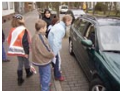
Aber trotzdem waren alle Autofahrer sehr nett zu uns!