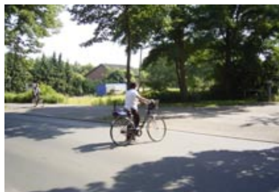
Am Ende des Radwegs „ Erzbahntrasse“ muss man ganz schön aufpassen, wenn man den Lipper Weg überqueren will

Wir diskutierten mit Herrn Lutz, was man denn an dieser Stelle verbessern könnte. Ein guter Tipp ist natürlich: ganz doll aufpassen und sich vor dem Überqueren der Fahrbahn versichern, dass auch kein Fahrzeug mehr kommt. Wir schauen also links, rechts und wieder links! Wenn diese Stelle allerdings etwas mehr auffallen würde, könnten wir auch sicherer über die Strasse kommen. Wie wäre ein Zebrastrreifen?!