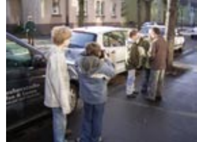
Lagebesprechung: Was ist zu tun?