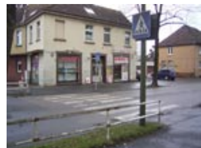
... auf der anderen Seite ist ein Kiosk. Also zwei durchaus attraktive Ziele für Kinder!