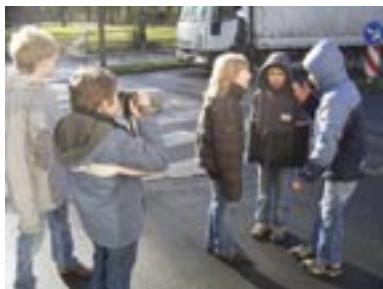
Das Filmteam bei der Arbeit am Zebrastreifen: „Ey, die Autofahrer halten nicht an, sehen die uns nicht?“