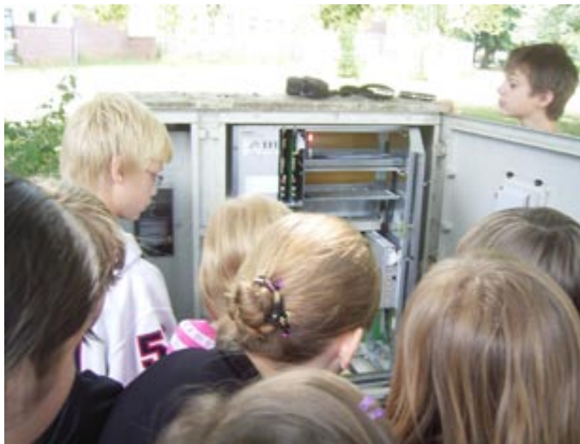
Das Steuergerät der Ampelkreuzung Kampstraße/Lipper Weg