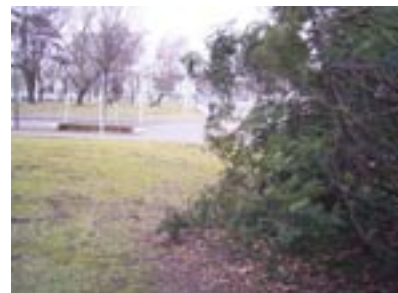
...da konnten wir uns nämlich prima verstecken und die Autofahrer heimlich beobachten!