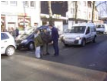
Der Autofahrer hat sich fürchterlich erschrocken über die Kinder auf der Fahrbahn und stellt sie zur Rede