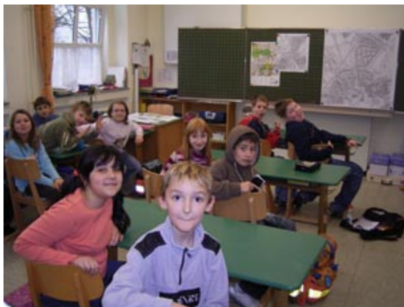
Wir freuen uns schon alle, dass es endlich los geht

Besonders spannend fanden wir, dass wir ganz viele Ausflüge gemeinsam unternehmen werden und dass wir auch einige Veränderungen in unserem Stadtteil ganz alleine vornehmen dürfen (Markierungen, Büsche beschneiden usw.).