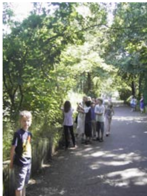
Bei einigen dicken Ästen mussten wir aber auch mit der langen Baumsäge ran