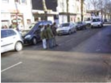
Nächster Drehort: Queren einer Straße ohne Hilfsmittel zwischen parkenden Autos auf der Römerstraße