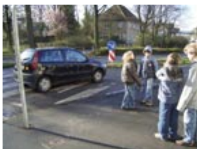
Bis alles im Kasten ist muss die Szene mehrfach wiederholt werden.