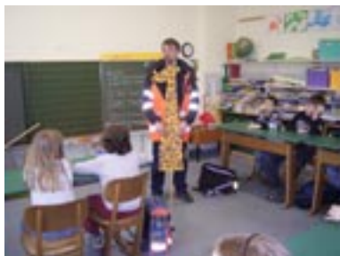
Selbstgebastelte Tierfiguren werden helfen, die dargestellte Problematik (nicht gesehen werden) zu verdeutlichen