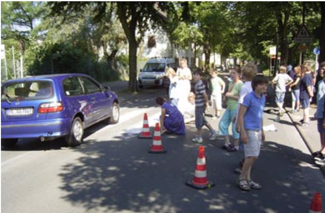
Hier markieren die Kinder einen Zebrastrreifen auf dem Lipper Weg, einer gefährlichen „Tempo 50 Straße“

Im Kinderstadtplan sind die unterschiedlichen Straßentypen nach ihrer Gefährlichkeit dargestellt. Es gibt gefährliche Straßen (in rot), auf denen Autos schneller als 30 km/h fahren dürfen. Sichere Straßen finde ich überall dort, wo nur 30 km/h oder weniger erlaubt sind (orange). Am sichersten für mich sind Spielstraßen (blau) oder Rad- und Fußwege (lila), auf denen die Autos nur mit Schrittgeschwindigkeit oder überhaupt nicht fahren dürfen.