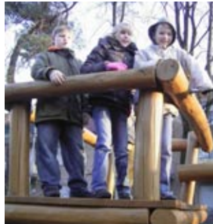
Die Spielmöglichkeiten auf unserem eigenen Schulhof sind ein guter Anfang