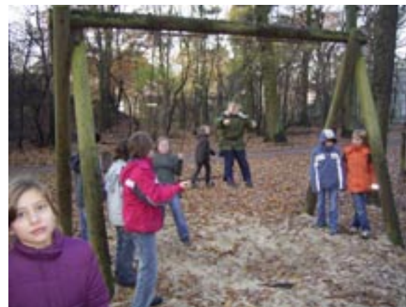
Der Spielplatz an der Gendorfer Straße gleich neben dem Jahnstadion war da schon ein wenig besser in Schuss und hatte auch tolle Spielgeräte