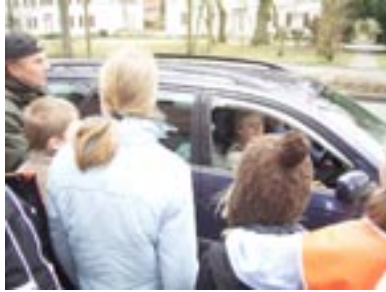
Manchmal mussten wir aber auch schimpfen, weil die Autofahrer zu schnell waren und einen „gelben Denkkzettel“ verteilen.