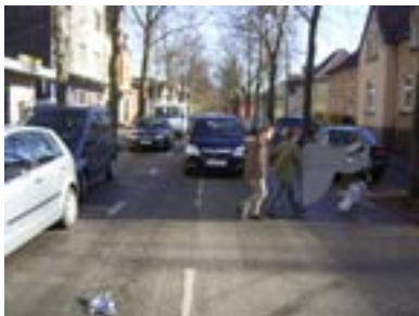
...dann gehen die Kinder sicher über die Straße, nachdem der Autofahrer sie wahrgenommen und auch angehalten hat!