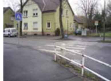
Unser erster Drehort Zebrastreifen Römerstraße: Auf der einen Seite befindet sich ein Spielplatz...