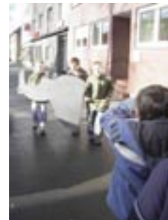
Das Nashorn kann uns helfen, weil es erst vorsichtig die Nase zwischen den parkenden Autos hervor streckt!