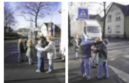
Ich hab 'ne Idee: Wie versuchen es mit unserem Zebrakopf !