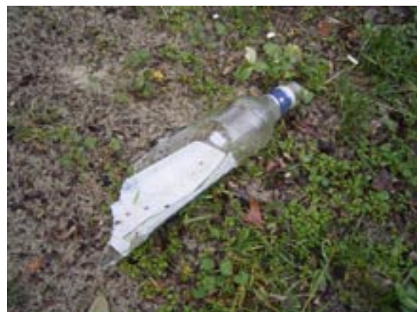
Einige Spielplätze sind nur für Kleinkinder da, ein Witz bei den Glasscherben!