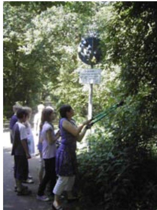
Erst einmal ist Freischneiden mit der Hecken-/Astschere angesagt!