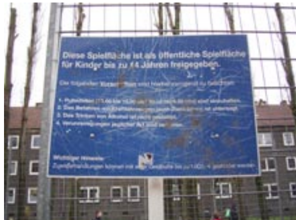
Wir fanden unterschiedliche Hinweisschilder: Lustige mit vielen Zeichnungen und langweilige mit Text (die werden dafür auch schnell kaputt gemacht!)